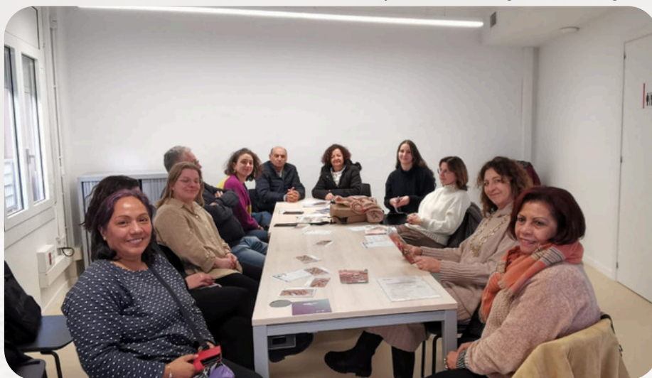
Csapatunk a kick-off meetingen Corbera de Llobregat-ban, Spanyolországban.

Miért: A demográfiai változások sürgős reformokat tesznek szükségessé az ellátórendszerekben. Az ápolásra szoruló emberek joguk van saját döntéseket hozni és aktívan részt venni a társadalomban. Az informális ápolók gyakran nem rendelkeznek az általuk betöltött megterhelő szerephez szükséges készségekkel és támogatással.