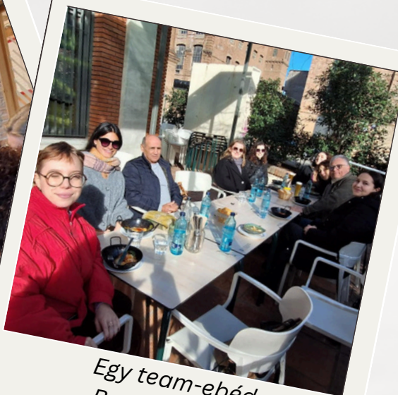
Egy team-ebéd Barcelonában

Video összefoglaló a kick-off meeting-ről